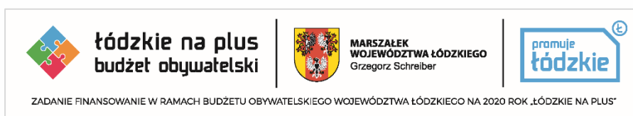
Baner, wzór 1 d